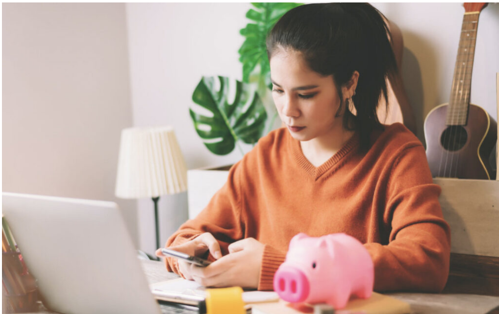
Préstamos rápidos sin intereses y sin comisiones

En gran parte esta falta de confianza se da por muchas compañías que, valiéndose de una imagen atractiva, ofrecen microcréditos al instante que luego asoman cargos ocultos en la letra pequeña del contrato.